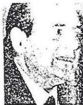
CÁNDIDO VELÁZQUEZ (53 años) Presidente de Telefónica

Los grupos informáticos Bull, Siemens y Olivetti han llegado a un acuerdo para crear una red común destinada a fortalecer la industria europea del sector. No obstante, la nueva red, que está todavía pendiente de la aprobación de la CE, mantiene abierta la posibilidad de que otras firmas informáticas no europeas se sumen al proyecto. Los tres socios anunciarán nuevas iniciativas antes de final de año. PÁGINA 62