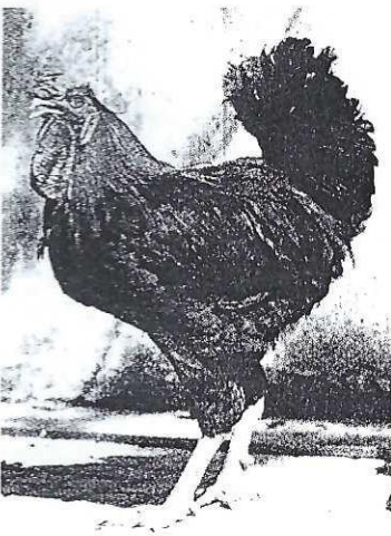
El Costa Brava rojo

echa al mundo unos 150 huevos al año, y si es de raza Prat, 20 o 30 más. Las superponedoras judías Anaka, las americanas Warren, las holandesas Hisex y las belgas Dekalb, vienen a producir el doble, lo que no es moco de pavo en un mundo poblado por 5.000 millones de gallinas (una cifra algo menor que la de humanos). En Tarragona, y sin ir más lejos, existe una granja en la que vi-