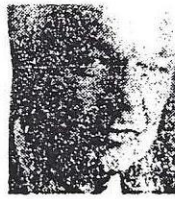
KARLHEINZ KASKE (62 años) Presidente de Siemens

El Gobierno francés prepara un plan de ayudas para las pequeñas y medianas empresas que incluye medidas tanto de carácter fiscal como financiero. Entre las medidas, que entrarán en vigor en 1992, destaca la reducción del tipo impositivo en el impuesto de sociedades, deducciones fiscales para las ampliaciones de capital, y un tratamiento más favorable para las plusvalías. PÁGINA 62