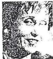
EDITH CRESSON (57 años) Primera ministra francesa